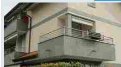
Appartamenti Paderno Dugnano Palazzolo, Vincenzo Gioberti